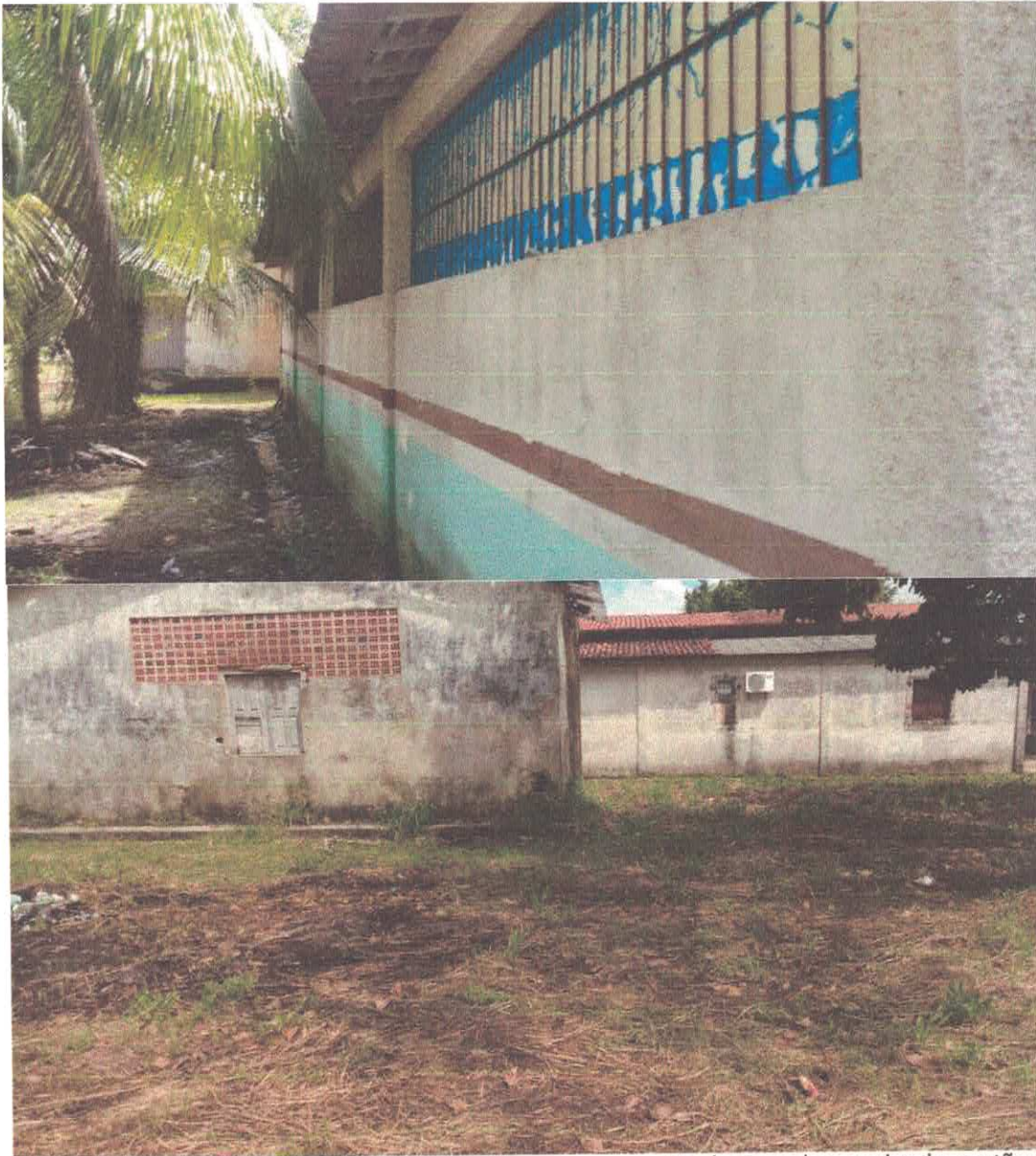
Foto 05: Vista da varanda/ parcial (CRAS) – Obs.: pintura antiga nos muros, piso desgastado e quebrado, portão de grade à ser substituído por portão de chapa metálica lisa ou metálica fechada (Espaço de construção da rampa de acessibilidade);