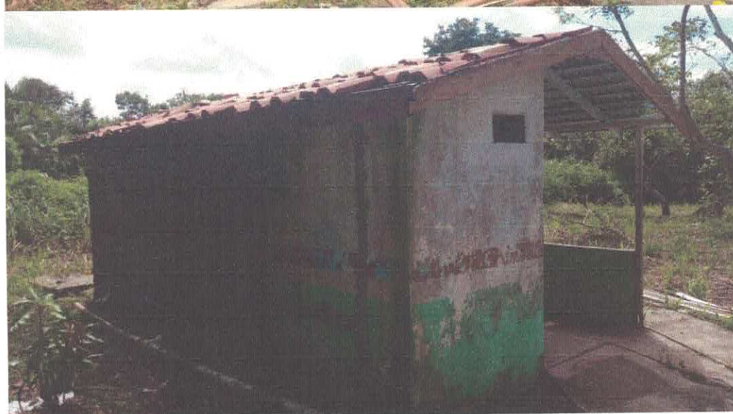
Foto 03 e 04: banheiros total impróprio para uso (CRAS), piso deteriorado precisando de reparos, repintura, refazer o telhado;