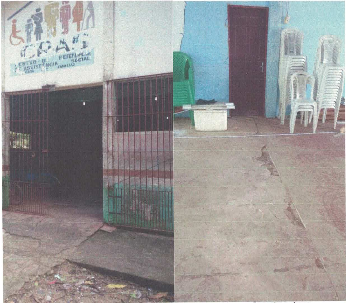
Foto 01: Vista frontal (CRAS) pintura antiga, deteriorada e portão inadequado.